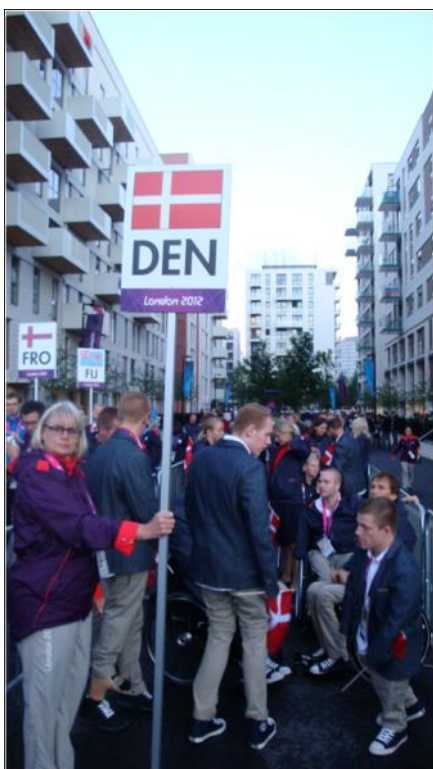
Klar til Åbningsceremoni 29. august 2012