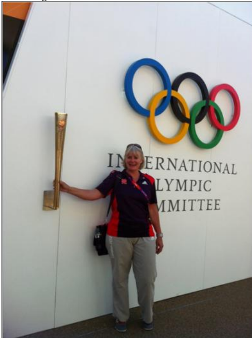
Olympiske Lege London 2012